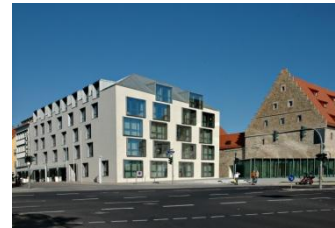
Brückenstr. 27, Schweinfurt