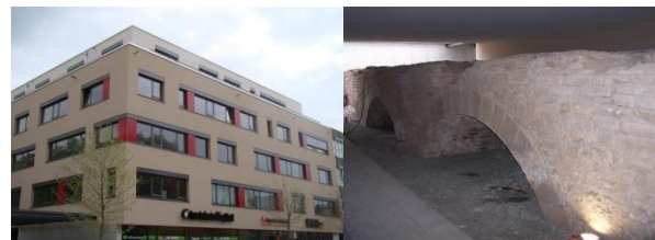
Schultesstr. 19, Schweinfurt