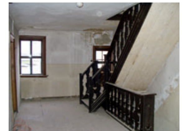
Das schöne historische Treppenhaus

Dieses Anwesen liegt im förmlich festgelegten Sanierungsgebiet und die WAG ist deshalb dankbar, dass entsprechende Städtebauförderungsmittel sowohl von der Stadt Schweinfurt als auch von der Regierung von Unterfranken und daneben noch Mittel vom Landesamt für Denkmalpflege zur Verfügung gestellt werden –