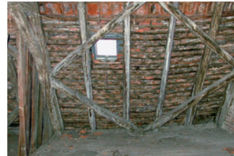
Der alte Dachstuhl

Es entsteht ein neuer Laden mit ca. 120 m 2 Nutzfläche, sowie