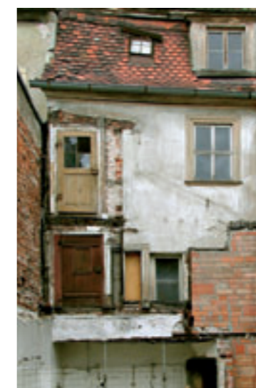
Blick auf den abgerissenen Anbau