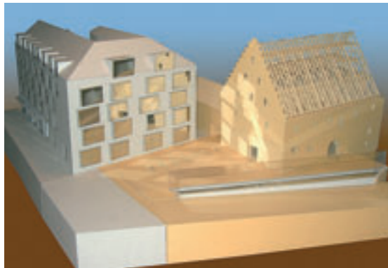
Modellansicht Hauptzollamt neues Gebäude links, Ebracher Hof rechts

Hier sind Büroflächen mit ca. 2.500 m 2 , die Ladenfläche mit ca. 300 m 2 und die Wohnung mit ca. 130 m 2 untergebracht.