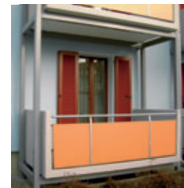
Erneuerung der Balkone

arbeiten wurden die Fassaden neu gestrichen und die maroden Holzklappläden wurden durch neue Aluminiumklappläden dauerhaft ersetzt. Die Balkone erhielten außer den neuen