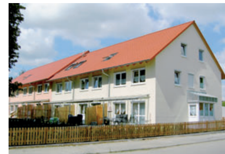
Der kleine Garten hinter dem Haus.