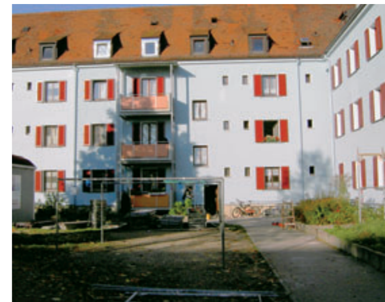
Hofansicht Niederwerrner Straße

Brüstungen aus verzinktem Stahl und wetterfesten Melaminharzplatten eine Fußbodenbeschichtung aus Epoxydharz.