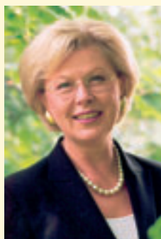
Oberbürgermeisterin Gudrun Grieser