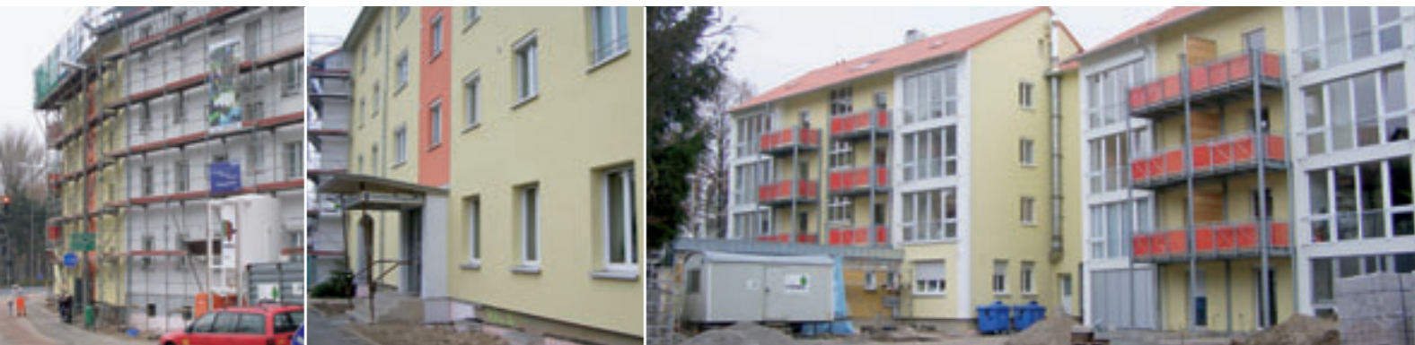
Zugang von der Schützenstraße

D as komplette Anwesen Schützenstrasse 3-9 präsentiert sich jetzt mit der hellen Außenfassade freundlich und einladend. Große vorge-setzte Balkone sowie Glasfronten im Wohnzimmerbereich, lassen die rückseitige Fassade „luftig und leicht“ erscheinen. Die Wohnungen haben hierdurch zeitgemäße Grundrisse, die einzelnen Räume sind großzügig und hell. Die Bäder – teilweise mit separaten Gäste – WC sind komplett saniert. Eine besondere Herausforderung für alle Mieter, Firmen und am Bau beteiligten WAG-Mitarbeitern war die zusätzlich nicht geplante Teilmodernisierung der Wohnungen Schützenstrasse 3. Mieter sind